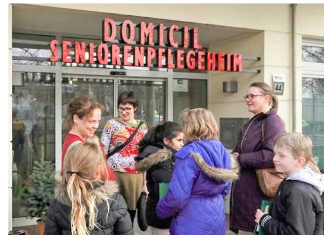
Vorfreude auf spannende Gespräche.