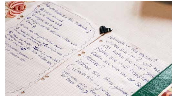
Fragenkatalog kleiner Journalisten.

Fragen kamen auf wie „Waren deine Eltern streng? Worauf waren Kinder stolz? Was gab es zu essen? Neben Schule, Freizeit und Sprache wurden Kriegs- und Nachkriegszeit schnell zum Thema, die Antworten gewissenhaft notiert, und es zeigte sich, wie empathisch Kinder auf ihr Gegenüber zuzugehen und dessen wichtigste Lebensmomente einfühlsam zu erkennen vermögen. Sie weckten bei den Zeitzeugen dabei auch Verdrängtes und alte Erinnerungen, die schmerzlich waren. Ein erster beeindruckender