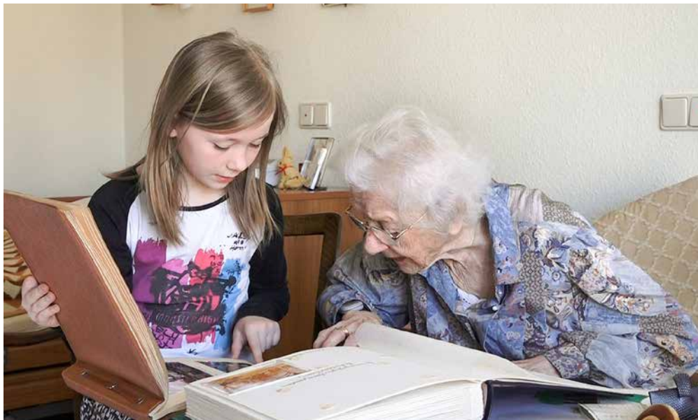
Jung fragt Alt.