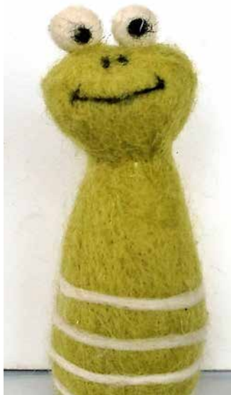
„Problemi“, das Projekt-Maskottchen.

Sachsenwald-Grundschul-Hort-Ganztagsbetreuung – viele mit einem anderen kulturellen Hin-