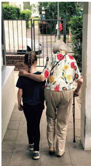
Viel mehr als nur Projekte...